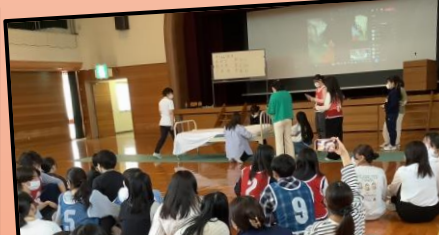
チームの技術をみんなでは援！